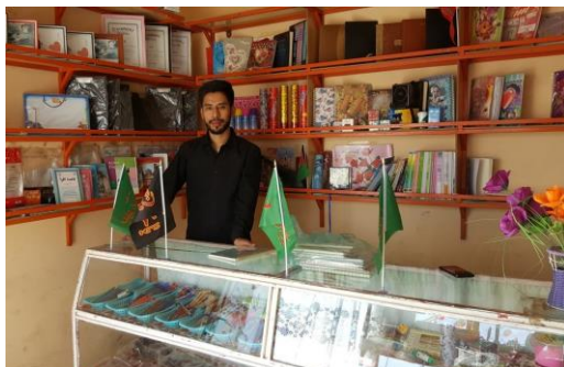
Bild: Ein Rückkehrer wurde in Afghanistan dabei unterstützt in eine Schreibwarenhandlung zu investieren, mit der er nun seinen Lebensunterhalt verdient. © IOM 2018